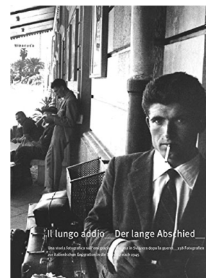
Livre des photographies d’Oswald Ruppen